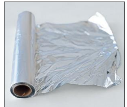
FOLIOPALA (näytteen suojaamiseksi UV- valolta)

Näytteen ottamiseen liittyvissä ongelmissa voitte ottaa yhteyttä tutkimuksen tilanneeseen osastoon/poliklinikkaan tai laboratorioon. Vastauksia voitte tiedustella hoitavasta yksiköstä/hoitavalta lääkäriltä sovittuna ajankohtana.